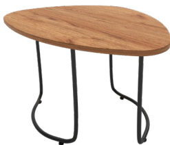
Mesa alta / High table