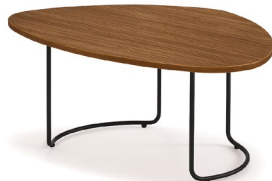
Mesa mediana / Medium table