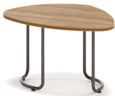
Mesa baja / Low table