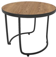
Mesa alta / Low table