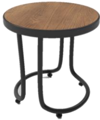
Mesa baja / High table