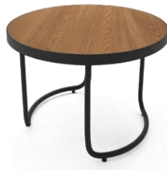
Mesa mediana / Medium table