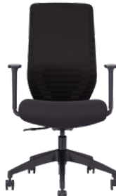
Estructura negra/tapizado negro/black structure / black upholstery

Opcional: Con Cabecero/Sin Cabecero Optional: With headboard/Without headboard