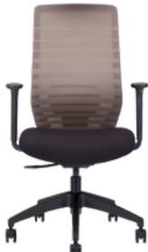
Estructura negra/tapizado gris /black structure / grey upholstery