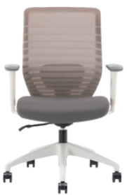
Estructura blanca/tapizado gris /white structure / grey upholstery