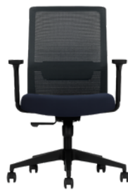
Estructura negra/tapizado negro /black structure / black upholstery

Opcional: Con Cabecero/Sin Cabecero Optional: With headboard/Without headboard