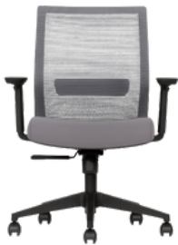
Estructura negra/tapizado gris /black structure / grey upholstery