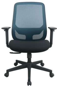
Estructura negra/tapizado azul /black structure / blue upholstery