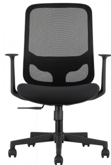
Estructura negra/tapizado negro /white structure / negro upholstery