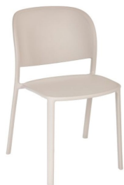
Pearl / Pearl