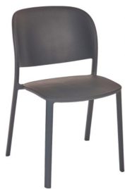
Anthracite / Anthracite