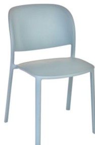
Blue gray / Blue gray