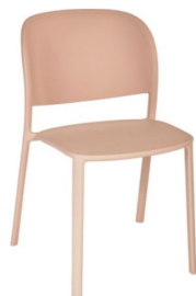
Soft pink / Soft pink

FECHA ACTUALIZACIÓN FICHA TÉCNICA 16/12/2025 / DATE OF TECHNICAL DATASHEET UPDATE 16/12/2025 TODA LA INFORMACIÓN CONTENIDA EN ESTA FICHA ESTÁ DISPUESTA A CAMBIOS EN LA MATRIZ DE ACABADOS Y/O AJUSTES DEL PRODUCTO, Y SU DISPONIBILIDAD AL MOMENTO DEL PEDIDO / ALL INFORMATION CONTAINED IN THIS DATASHEET IS SUBJECT TO CHANGES IN THE FINISHES MATRIX AND/OR PRODUCT ADJUSTMENTS, AS WELL AS ITS AVAILABILITY AT THE TIME OF ORDER.