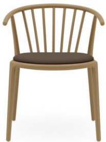
Con tapizados / with upholstery