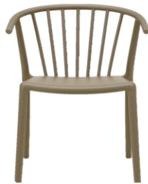
Sin tapizados / without upholstery

Opcional tapizados: ver matriz de acabados / Optional upholstery: see finishes matrix