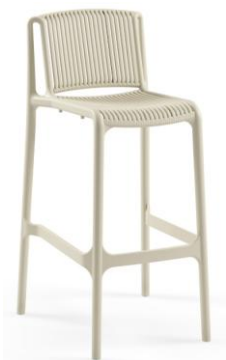
Beige / Beige