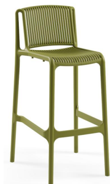
Khaki / Khaki