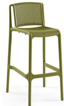
Khaki / Khaki

Cumple con certificación Catas EN 581-1:2017 y EN 581-2:2015+AC:2016 / Meets Catas certification EN 581-1:2017 and EN 581-2:2015+AC:2016